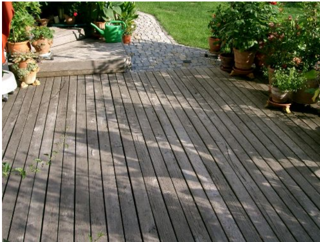
Terrasse aus EICHE Brettbreite 10 cm, glatt Überlängen bis 5 m mit natürlich grauer Patina in beabsichtigter, unverfälschter Naturholzoptik

+ Alle drei Hölzer verfügen über eine herausragende natürliche Resistenz gegen Fäulnis ganz ohne chemisch-imprägnierenden Holzschutz. Sie erfüllen die Resistenzklasse 2 nach DIN/EN 350-2 (1 = sehr resistent bis 5 = nicht resistent) ganz ohne giftige Holzschutzmittel